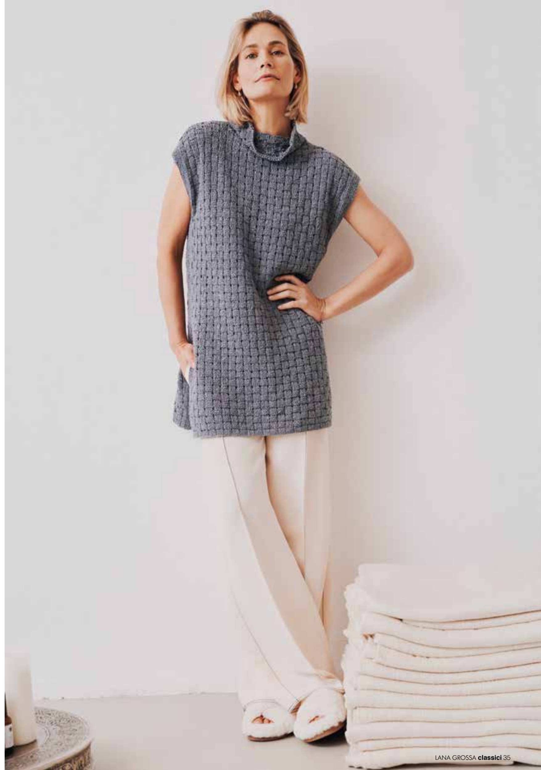
24 – TUNIKA Ob pur, mit Longsleeve oder Bluse getragen – dieses Teil wirkt immer entspannt-elegant. Sein Flechtmuster und das strukturierte Garn sorgen für ein lebhaftes, aufgelockertes Strickbild. BACCA