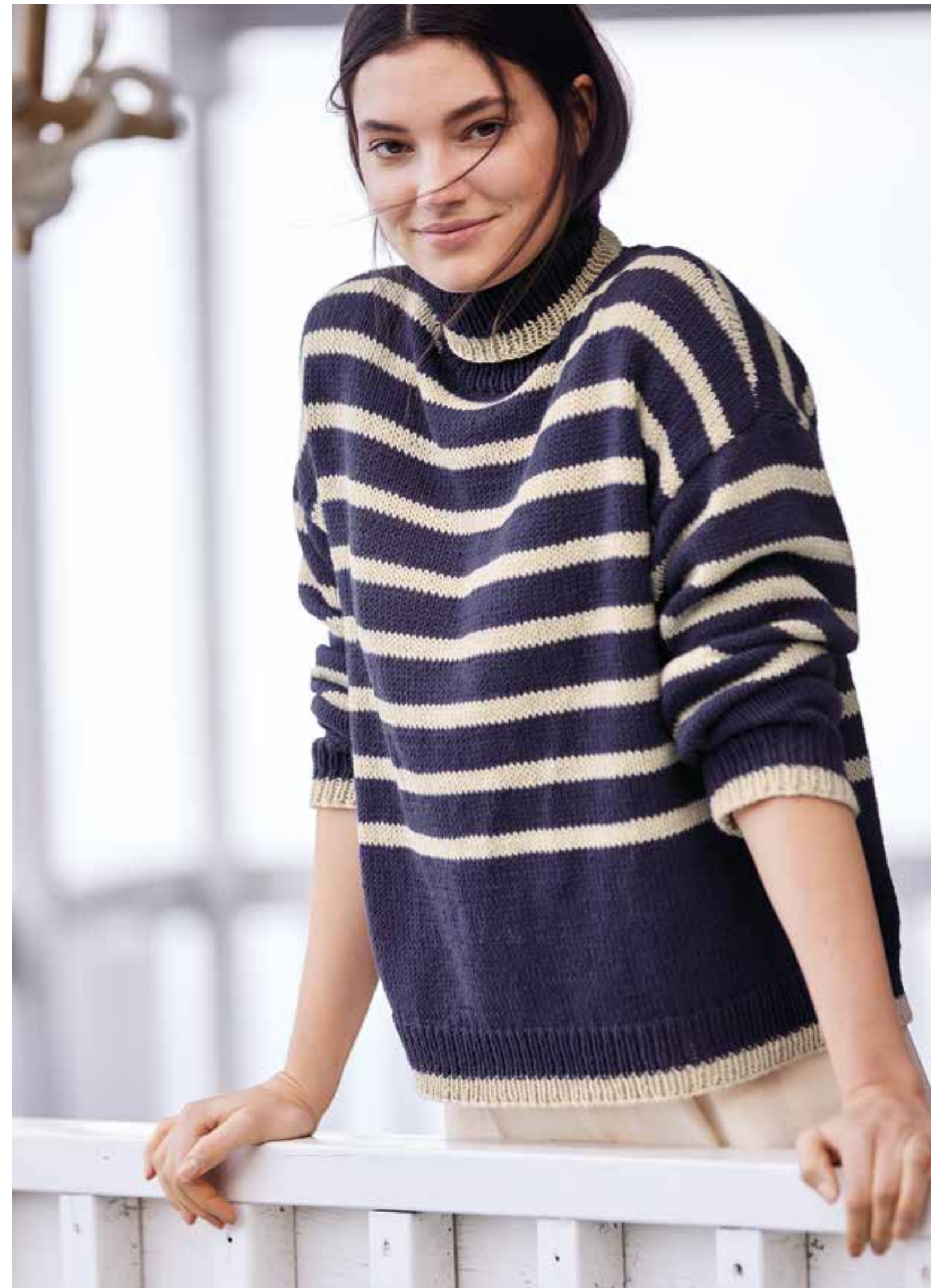
03 – ROLLKRAGENPULLOVER Klassische Marineringel, eine simple Machart (glatt rechts gestrickt) und Baumwolle mit 20 Prozent herrlich weichem Alpaka (Baby): Ein unkomplizierter Sweater für kühlere Tage. BRIGITTE NO. 4