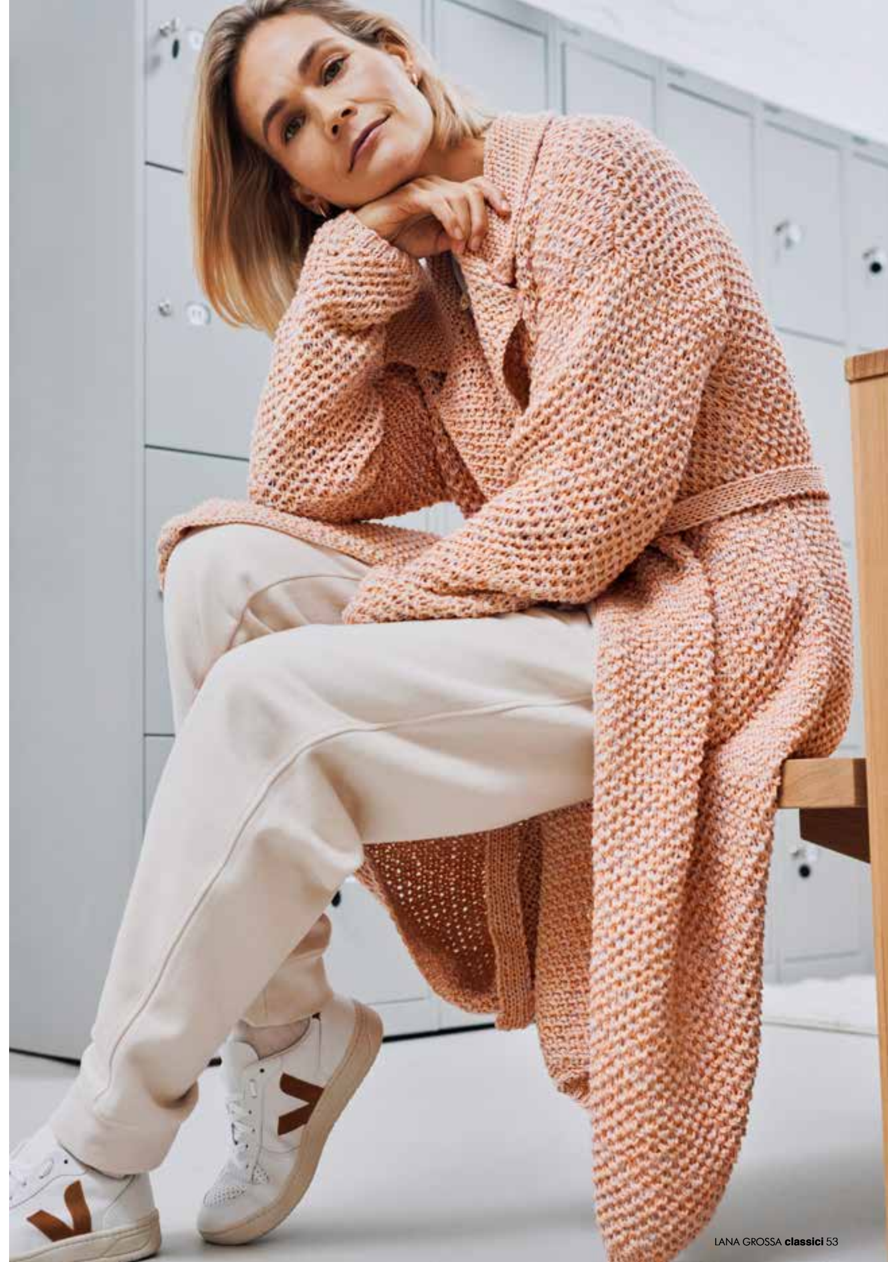
36 – MANTEL Mit seinem Strukturmuster und der lockeren Silhouette erinnert das Prachtstück an Morgenmäntel im Waffelpikee. Gestrickt wird doppelfädig, in Silbergrau und Apricot. BRIGITTE NO. 4 + ALLORA