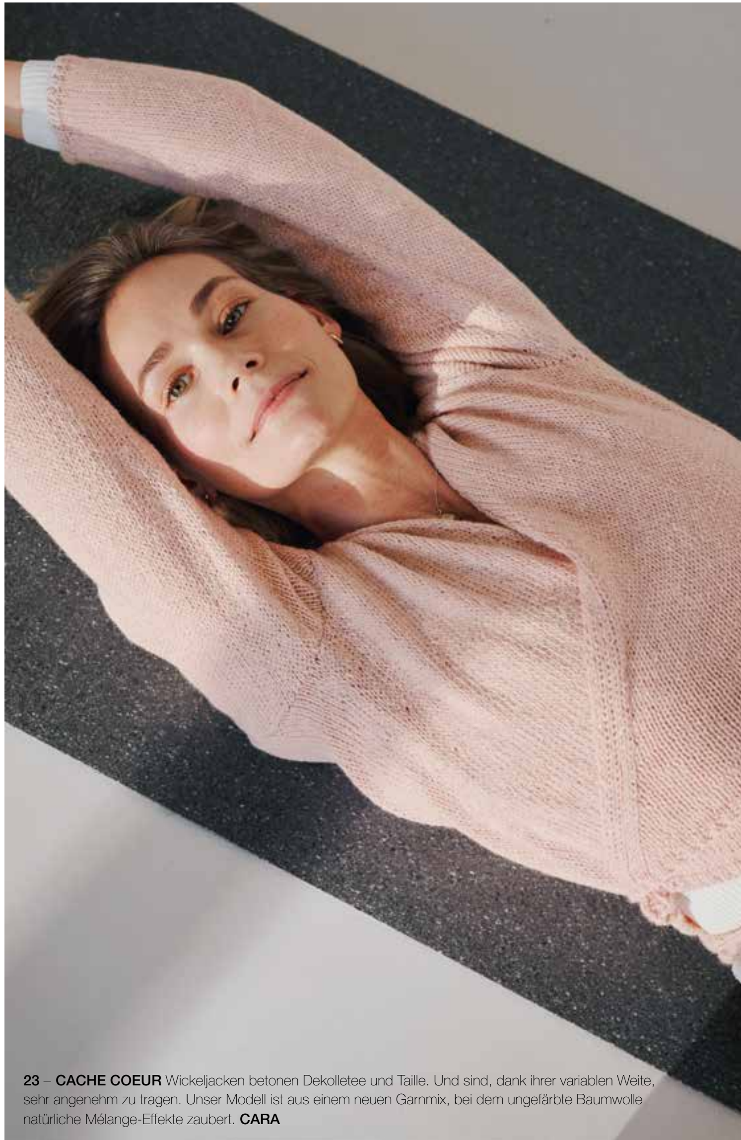
23 – CACHE COEUR Wickeljacken betonen Dekolletée und Taille. Und sind, dank ihrer variablen Weite, sehr angenehm zu tragen. Unser Modell ist aus einem neuen Garnmix, bei dem ungefärbte Baumwolle natürliche Mélange-Effekte zaubert. CARA