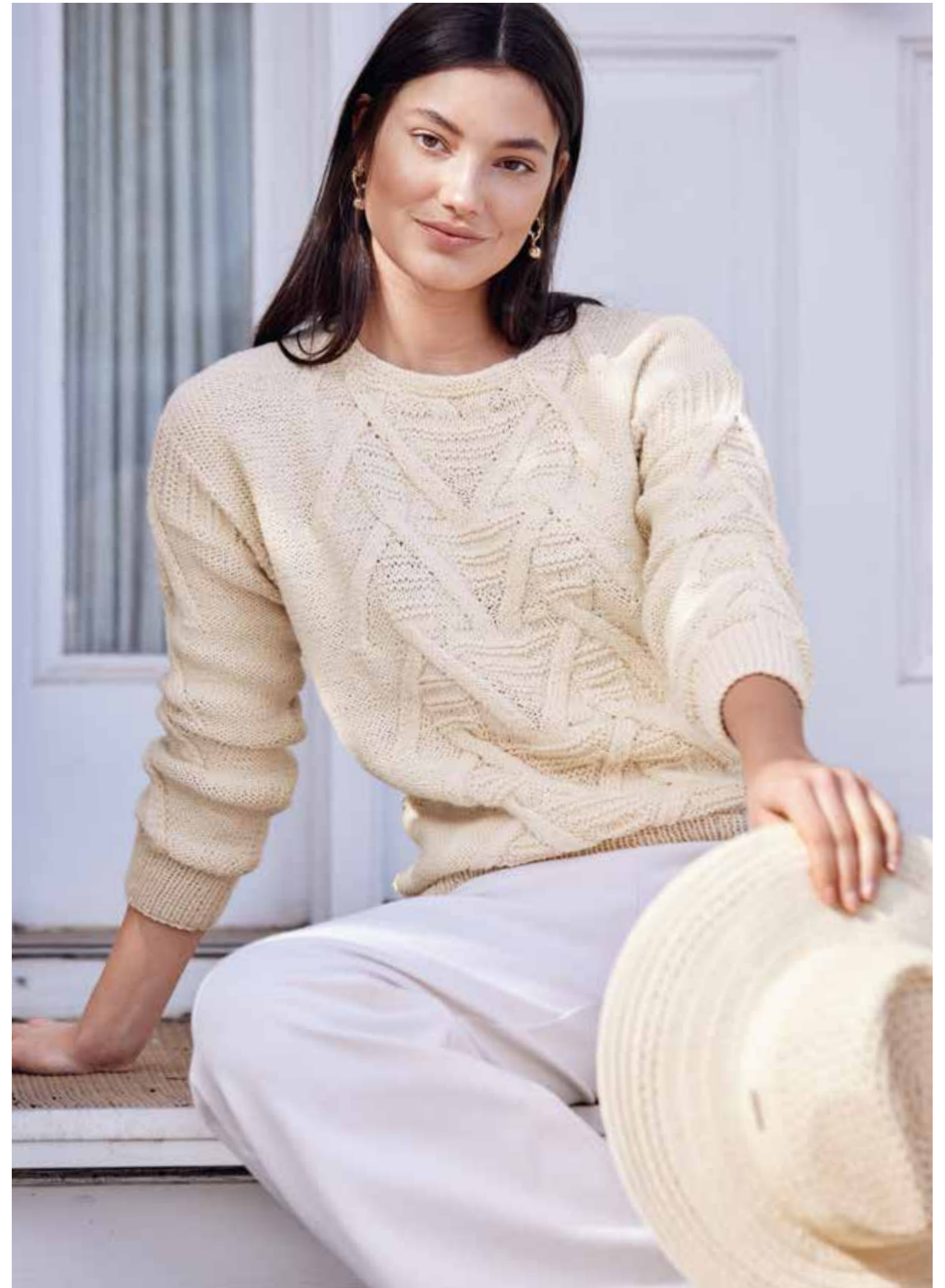
05 – PULLOVER Dekorative Muster und eine dezent melierte Qualität verleihen dem blassgelben Sweater eine ausdrucksvolle Struktur. Garnneuheit Cara (Alpaka (Baby), Baumwolle, Schurwolle (Merino)) und die klassische Silhouette machen ihn zum idealen Ganzjahresmodell. CARA