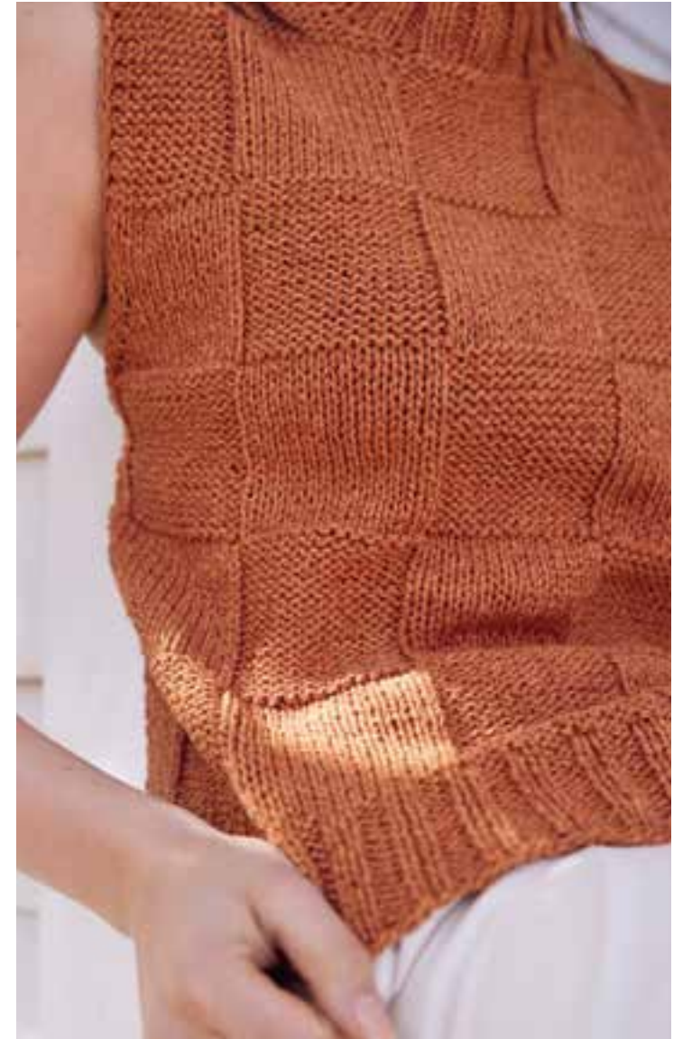
06 – TOP Rotbraun meliertes Seidenmixgarn und ein simples Schachbrettmuster – fertig ist das Wow-Piece für Anfänger und Ungeduldige. LANDLUST SOMMERSEIDE