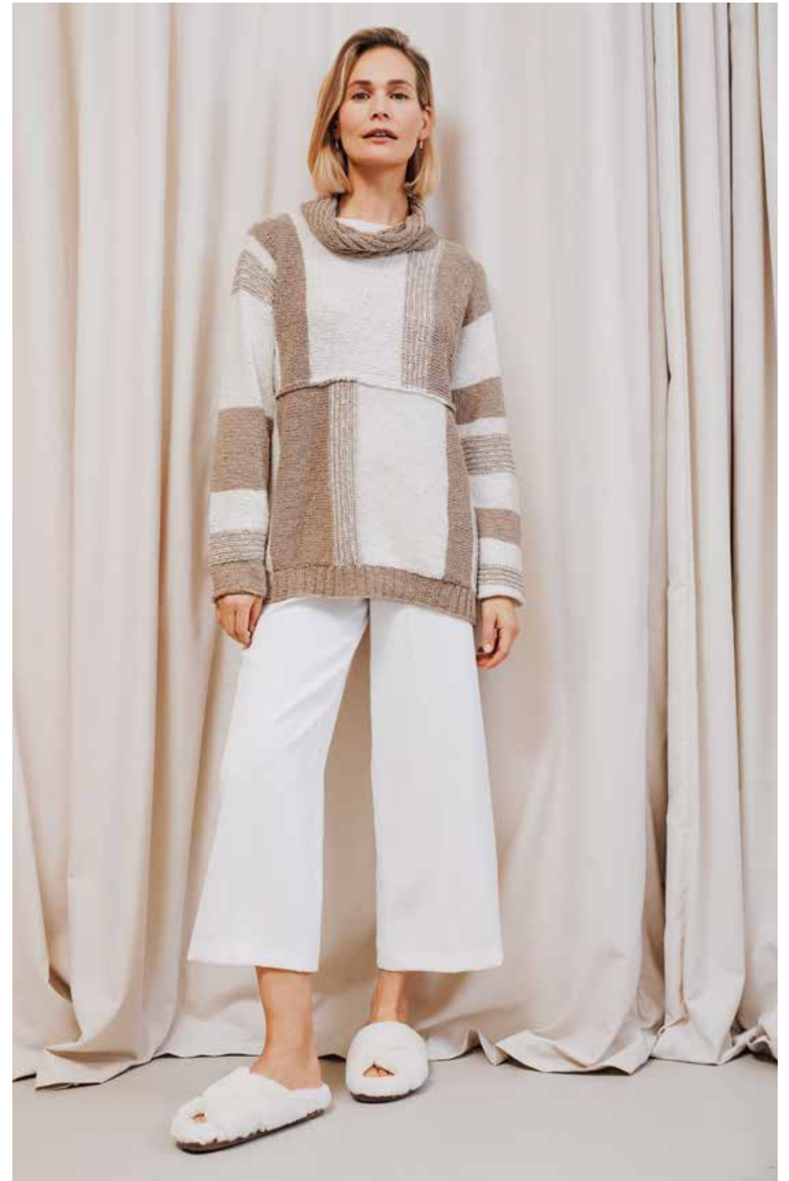
31 – PULLOVER + LOOP Beim quergestrickten Pulli sind Farben und Muster von Berber-Teppichen inspiriert. Strukturier-tes Garn und sichtbare Nähte unterstreichen seinen kernigen Charme. Dazu gibt es einen lässigen Loop. BACCA