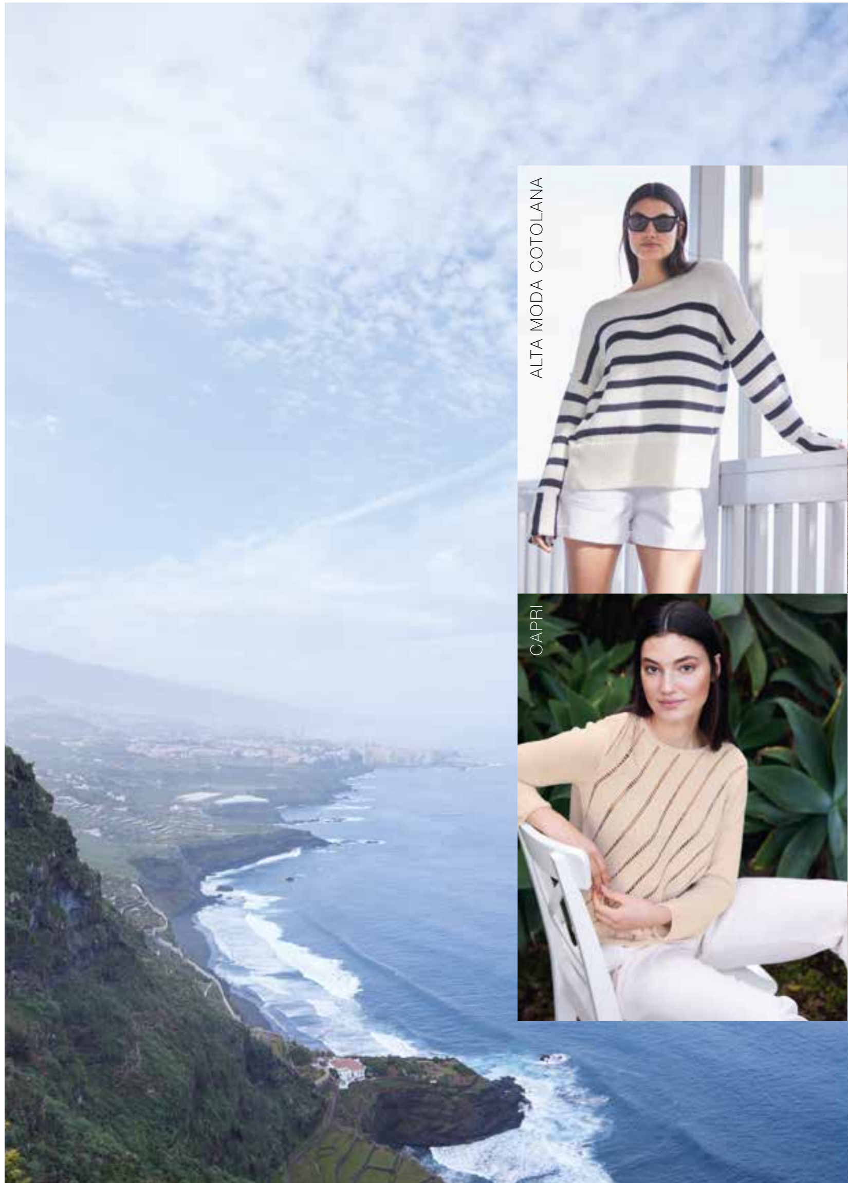
ALTA MODA COTOLANA