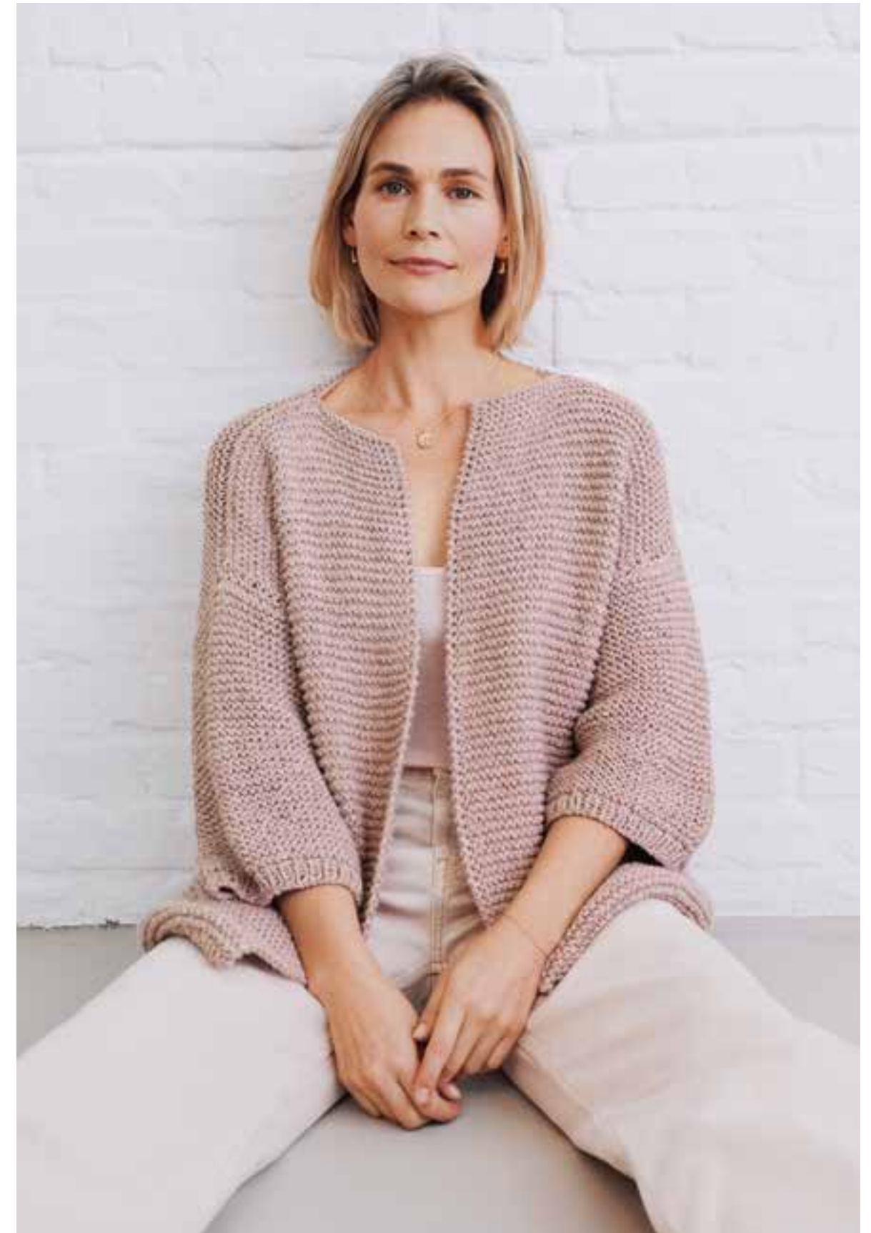
32 – JACKE Supereasy, superchic: Simple, kraus rechts gestrickte Vierecke geben unserer Jacke einen coolen, skulpturalen Look. Ihr rauchiger Altrosaton wirkt wie ein Weichzeichner und ist gerade sehr gefragt. CARA