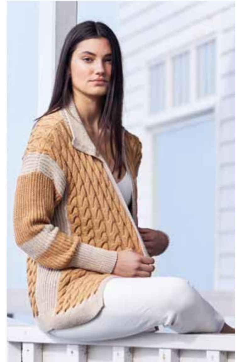
04 – JACKE Camel und Beige setzen bei der spektakulären Zopf-Rippen-Jacke beruhigende Akzente. Das Baumwollgarn mit einem Hauch Polyester hält die Pracht in Form. ELASTICO