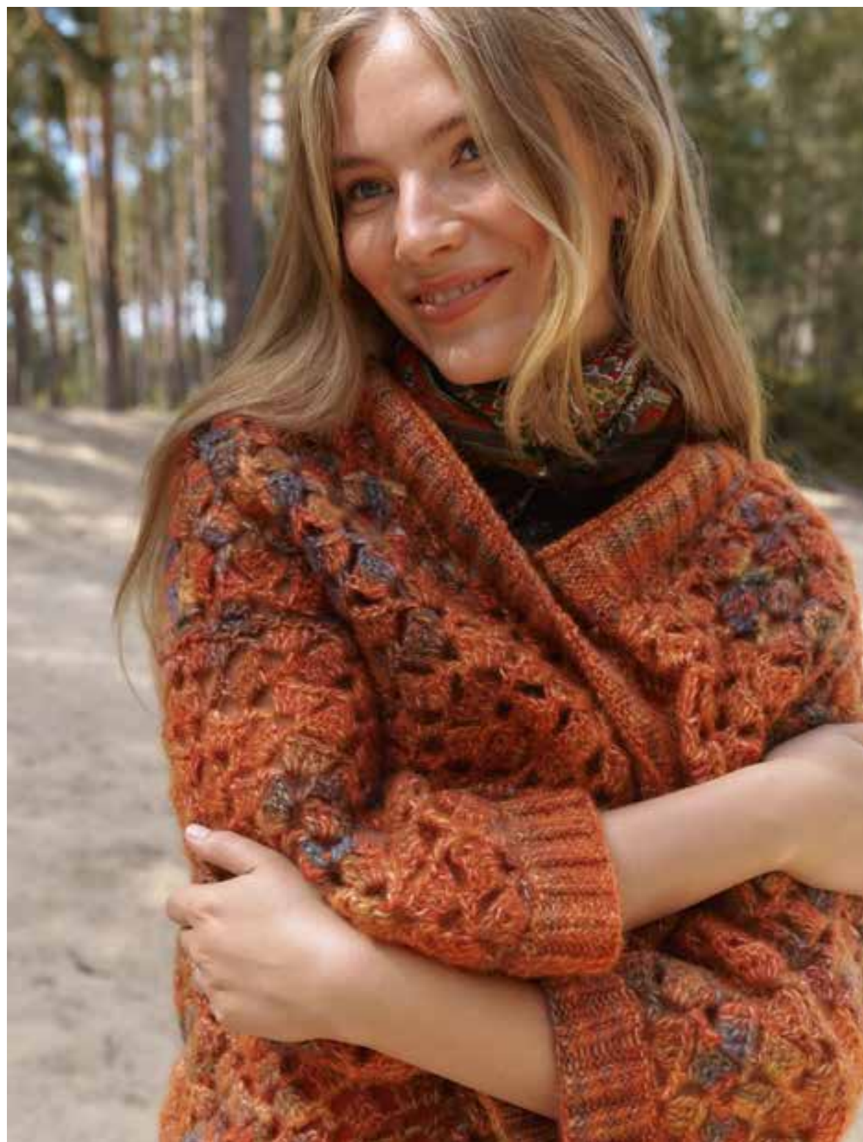
Wir feiern den Indian Summer – mit Verlaufsgarn in Herbstlaubtönen und einem Stäbchenmuster, das an kleine Blätter erinnert. Der Cardigan hat einen V-Ausschnitt, ansonsten besteht er aus geraden Teilen. 09-Cardigan | Picasso