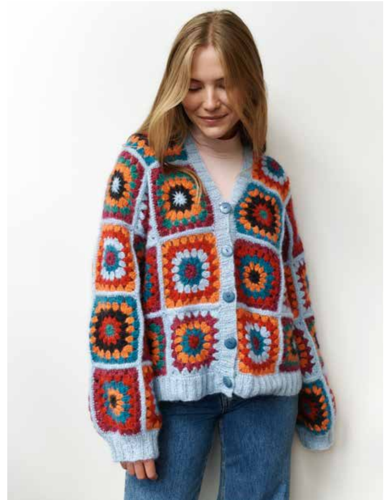
LINKE SEITE: Für Modernisten – die Jacke mit clean inszenierten Granny Squares, neuen Farbkombinationen und gestrickten Ärmeln in trendgerechter Ballonform. 13-Jacke | Brigitte No. 2 . OBEN: Für Traditionalisten – Großvaters Strickjacke prunkt hier mit 50 klassischen Granny Squares. Ein Traumteil, sofern Näharbeit für Sie keine Strafarbeit ist. 14-Jacke | Superkid Seta