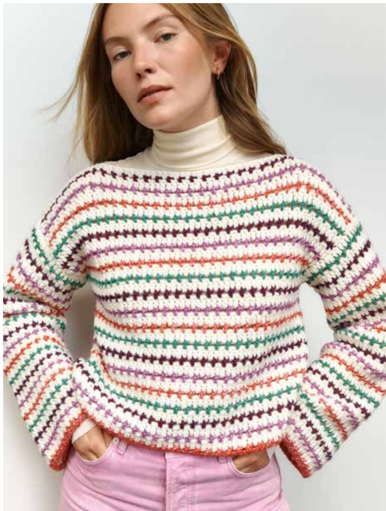
U-Boot-Ausschnitt, schmale Passform, gerade Ärmel und feine Ringel: Unsere Verbeugung vor den Looks der Siebziger, besonders stilecht mit Feinstrickrollis und Schlaghosen. 15-Pullover | Cool Merino Big + Twinnny. RECHTE SEITE: Bunte Blockstreifen, aufgelockert mit viel frischem Weiß: Jawoll, Gehäkeltes kann auch sportlich. 16-Pullover | Soffio + Ecopuno