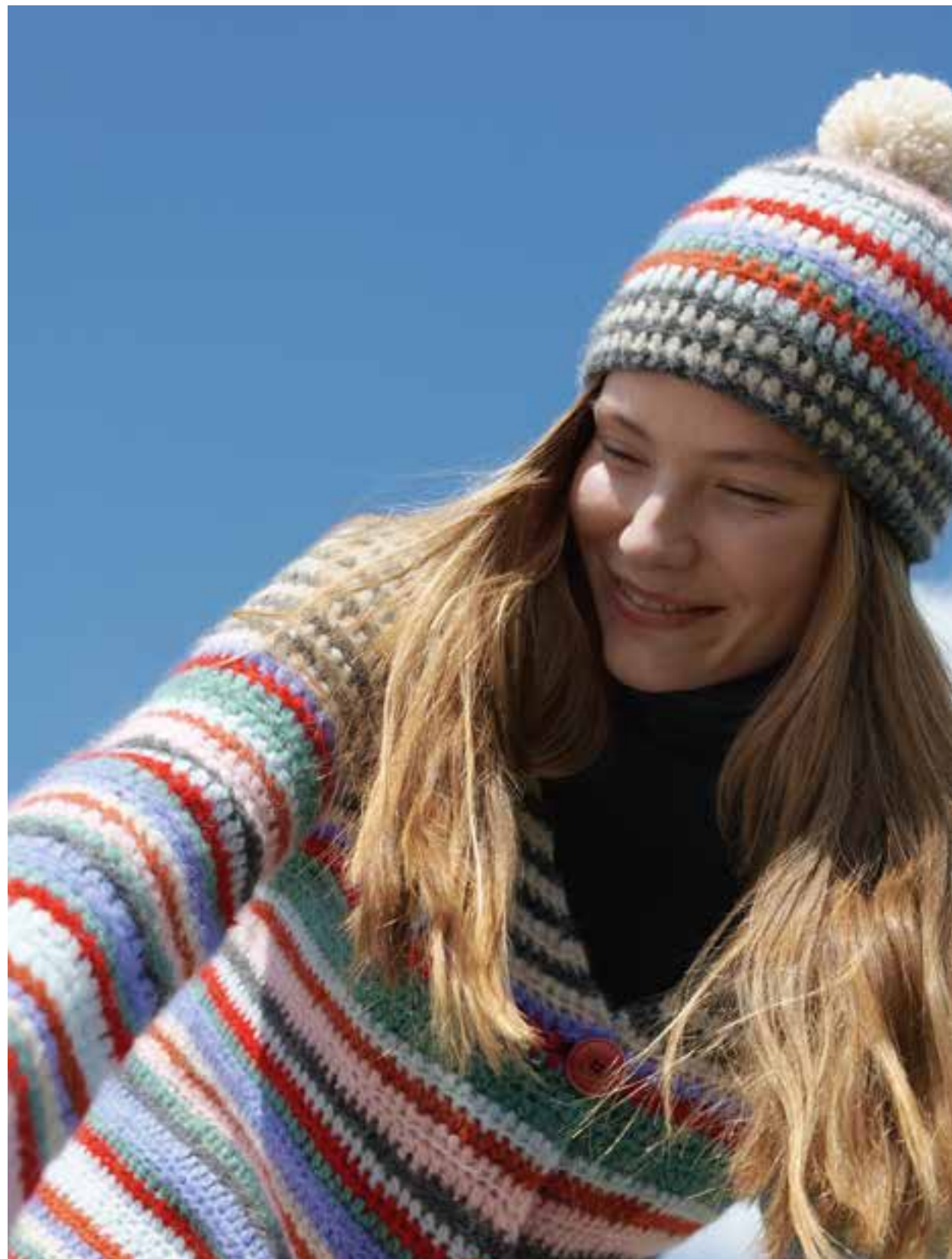
Zusammen stark: das Doppel aus einem fluffig-warmen Alpakagemisch. Die Jacke wird top-down gehäkelt, was die Ringel auf eine Linie bringt. Dazu gibt es eine Bommelmütze, die, wie die Jacke, aus halben Stäbchen besteht. 19 / 20-Mütze + Jacke | Alpaca Air